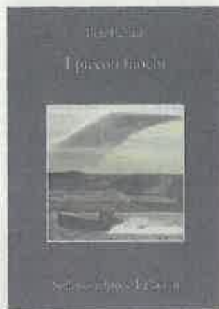
La copertina del romanzo

Si tratta dell'undicesima opera - contraddistinta dal personale, raffinato stile dell'autrice che sa abilmente intrecciare romanzo storico, mystery e racconto d'ispezione psicologica - avente come protagonista il giovane Martin Bora, nobile e tormentato ufficiale della Wehrmacht e collaboratore dell'Abwehr, nonché acuto investigatore dotato di razionalità, tenacia e amore per la verità, che ritroviamo raccontato in un arco temporale che si articola dal 1936 al 1944 e durante la seconda guerra mondiale, parzialmente ispirato, come ammesso dalla stessa autrice, alla figura reale del colonnello Claus Schenk von Stauffenberg che fu, insieme ad altri ufficiali di alto rango, tra i responsabili del fallito attentato contro Hitler del 20 luglio 1944. Martin Bora è l'eroe che ignora le terribili avversità che ostacolano il