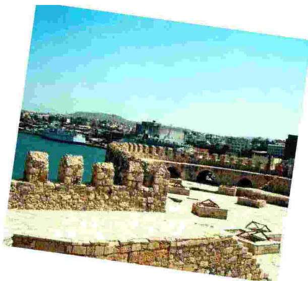
Il castello veneziano al porto di Hiraqlion a Creta